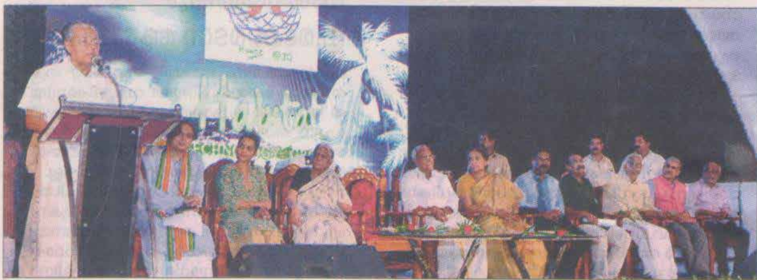
ഹാബിറ്റാറ്റിന്റെ മൂപ്പതാം വാർഷികഘോഷങ്ങളുടെ ഉദ്ഘാടനം മുഖ്യമന്ത്രി പിണറായി വിജയൻ നിർവഹിക്കുന്നു