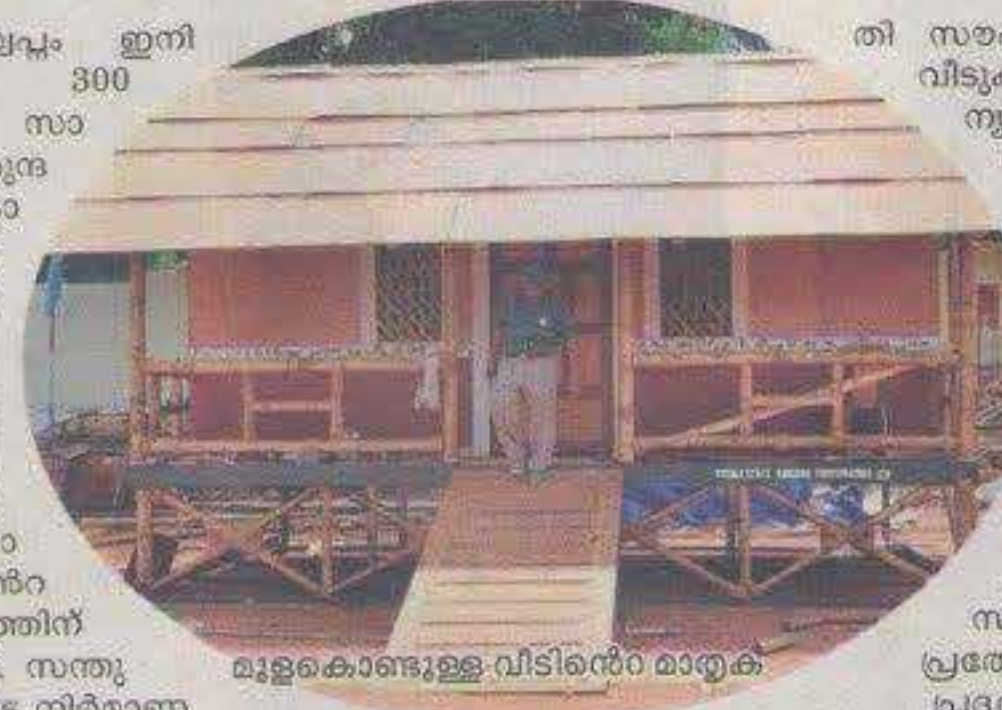
മുളകൊണ്ടുള്ള വിടിയൻറ മാതൃക

വി ടെന്ന സ്വപ്നം ഇനി വിദൂരമല്ല. 300 സ്കയർഫീറ്റിൽ സാധാരണക്കാരന് സുന്ദരമായൊരു വിടിയൻറുക്കും. അതും ചുരുങ്ങിയ ചെലവിൽ. മുപ്പതാം വാർഷികത്തോടനുബന്ധിച്ച് ഹാബിറ്റാറ്റ് ടെക്നോളജി ഗ്രൂപ്പാണ് സാധാരണക്കാരൻ്റെ വിടെന്ന സ്വപ്നത്തിന് നിറം പകരുന്നത്. സന്തുലിതമായ പാർപ്പിട നിർമ്മാണ പദ്ധതികൾ നേരിട്ട് കണ്ടും തൊട്ടും അനുഭവിച്ചും മനസ്സിലാക്കാനുള്ള അവസരമാണ് പൂജപ്പുര തൈതാനത്തിൽ ഒരുക്കിയിരിക്കുന്ന 'ഹാബ്ഫെസ്റ്റ്'.