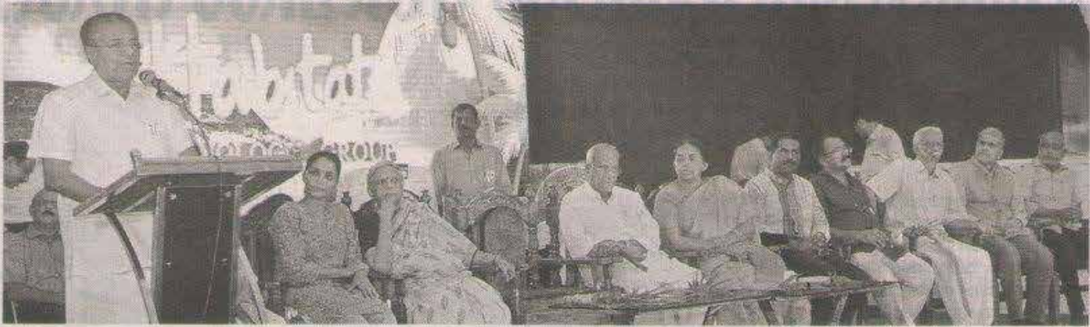
▶ ഹാബിറ്റാറ്റ് ടെക്നോളജി ഗ്രൂപ്പ് 30-ാം വാർഷികാഘോഷം മുഖ്യമന്ത്രി പിണറായി വിജയൻ ഉദ്ഘാടനം ചെയ്യുന്നു

വിശ്വപ്രശസ്ത വാസ്തുശിൽപ്പി ലാറി ബേക്കറിന്റെ പ്രവർത്തനങ്ങൾ ഏറ്റെടുത്ത് മുന്നോട്ടുപോകുകമാത്രമല്ല അത് അന്യദേശങ്ങളിലേക്ക് വ്യാപിപ്പിക്കാനും ഹാബിറ്റാറ്റിന് കഴിഞ്ഞു. ഇതിനു പുറമെ രാജ്യത്തുടനീളം 35 ഓഫീസ് സമുച്ചയം ഹാബിറ്റാറ്റ് നിർമ്മിച്ചിട്ടുണ്ട്. ഈ അർപ്പണബോധ