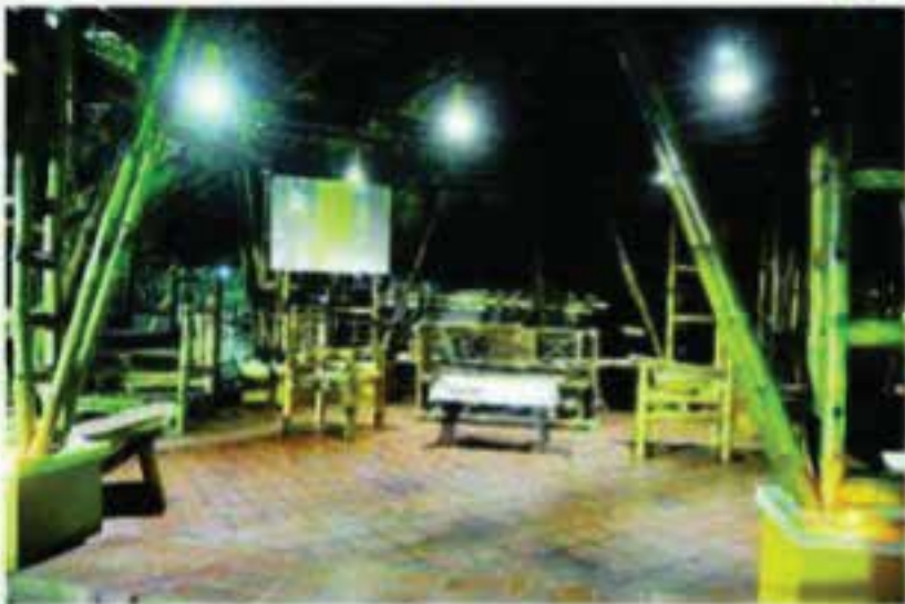
▶ മുറവൻമുറകളിൽ ഹാബിറ്റാറ്റിന്റെ മുറികൾ നിർമ്മിച്ചു നൽകിയിട്ടുണ്ട്.

ഹാബിറ്റാറ്റിന്റെ കെട്ടിടങ്ങളിൽ ഉൾക്കൊള്ളുന്നതാണ് ഇവയുടെ സവിശേഷതകൾ. ഹാബിറ്റാറ്റിന്റെ കെട്ടിടങ്ങളിൽ ഉൾക്കൊള്ളുന്നതാണ് ഇവയുടെ സവിശേഷതകൾ.