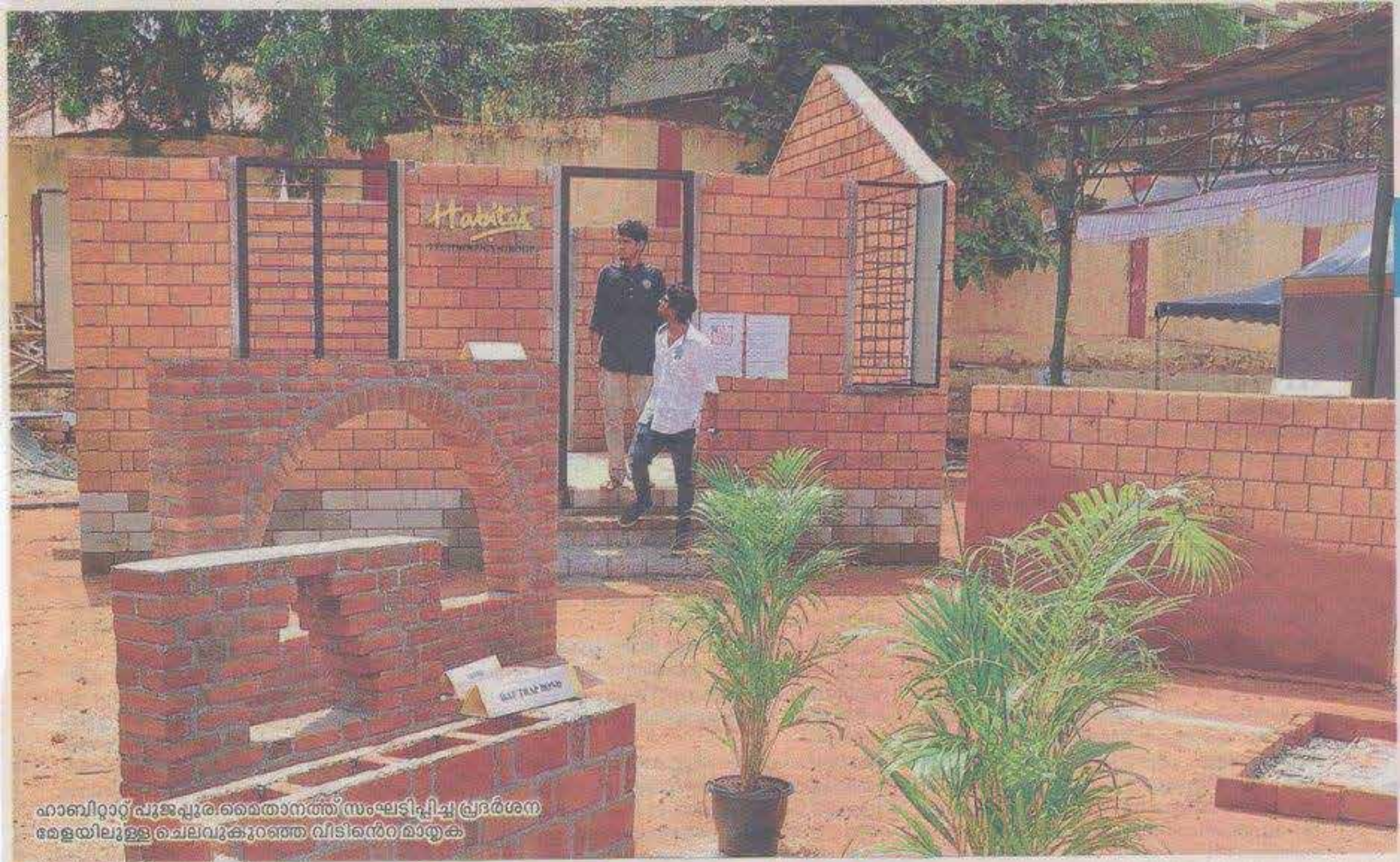
ഹാബിറ്റാറ്റ് പൂജപ്പുര തൈതാനത്ത് സംഘടിപ്പിച്ച പ്രദർശന രേഖയിലുള്ള ചെലവുകൾക്കുറഞ്ഞ വിടിയൻറ മാതൃക