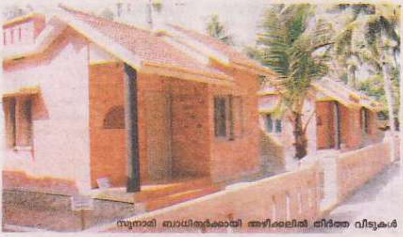
സ്മനായി ബാധിതർക്കായി അഴീക്കലിൽ തീർത്ത വീടുകൾ