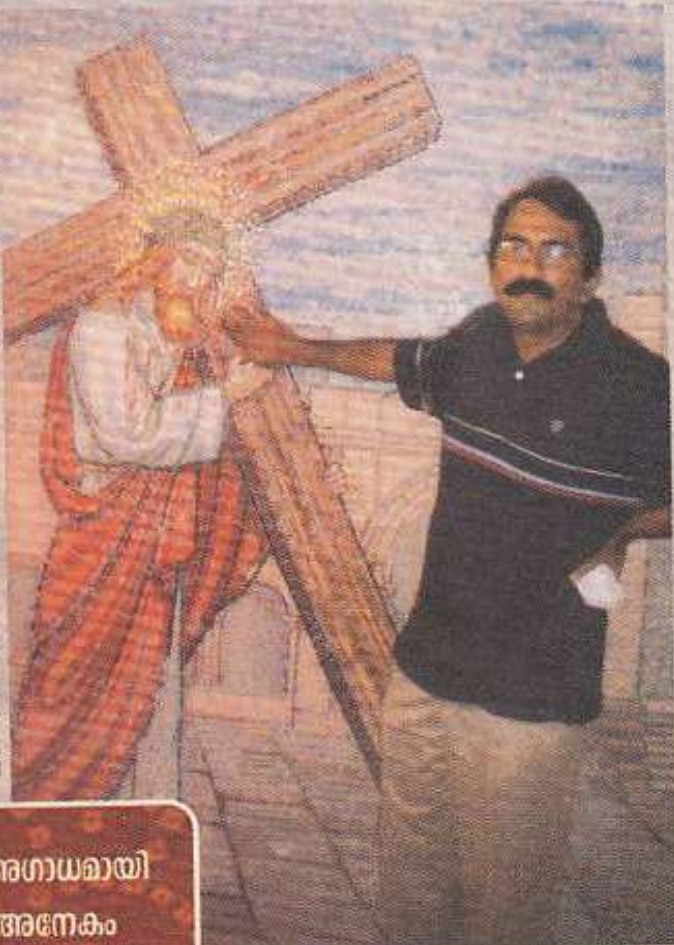
കുരിശിന്റെ വഴിയിൽ: ജറുസലേം. ഈ സ്ഥലത്തുവെച്ചാണ് യേശുവിന്റെ കൈയിൽ മരക്കുരിച്ച് താങ്ങാൻ ഏല്പിച്ചത്.

കഥകളും മറ്റും വായിച്ചിട്ടുണ്ടെന്നല്ലാതെ പഴയനിയമം ഒരിക്കലും ആഴത്തിൽ വായിക്കാൻ മുതിർന്നിട്ടില്ല ഞാൻ. ജറുസലേമിലേക്കൊരു യാത്ര എന്ന സ്വപ്നം. സാക്ഷാത്ക്കരിക്കപ്പെടുന്നു എന്ന യാഥാർത്ഥ്യത്തിന് മുന്നിൽ, യാത്രയ്ക്ക് തൊട്ടുമുമ്പാണ് ഞാനത് വായിച്ചു മനസിലാക്കുവാൻ തുടങ്ങിയത്. എന്ന് അഗ്രാധമായി സ്പർശിച്ച അനേകം ആത്മീയാനുഭവങ്ങളെ ആവഹിക്കുവാൻ ഈ വായന സഹായിച്ചിരുന്നു. മോശയുടെയും ഏലീയാറിന് രാജാവിന്റെയും ദർശനങ്ങൾ മനസിൽ പൂതിയ ചാലുകൾ കി