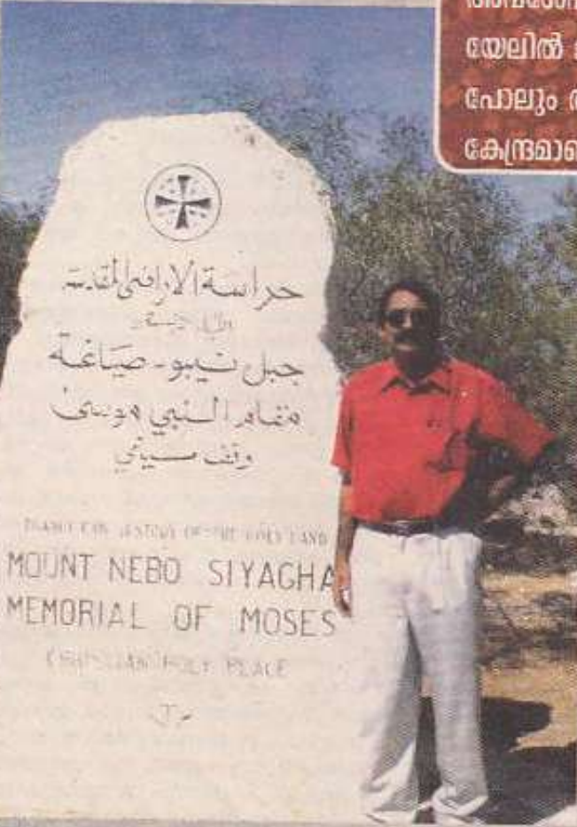
ഈ രണ്ട് നെബോ ജോർദ്ദാനി. മോശയുടെ മരണം നടന്നതിവിടെയാണെന്ന് കരുതപ്പെടുന്നു.

ലിന്റെ കല്ലുകൾക്കിടയിൽ വച്ചാൽ സാക്ഷാത്കരിക്കുമെന്ന് എല്ലാവരും വിശ്വസിക്കുന്നു.