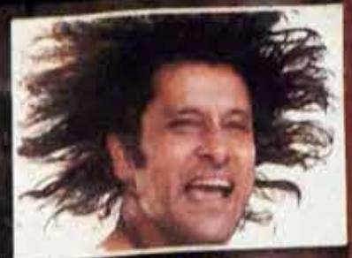
ജീവിതത്തിൽ ഞാനൊരു റെഡ്ഡി