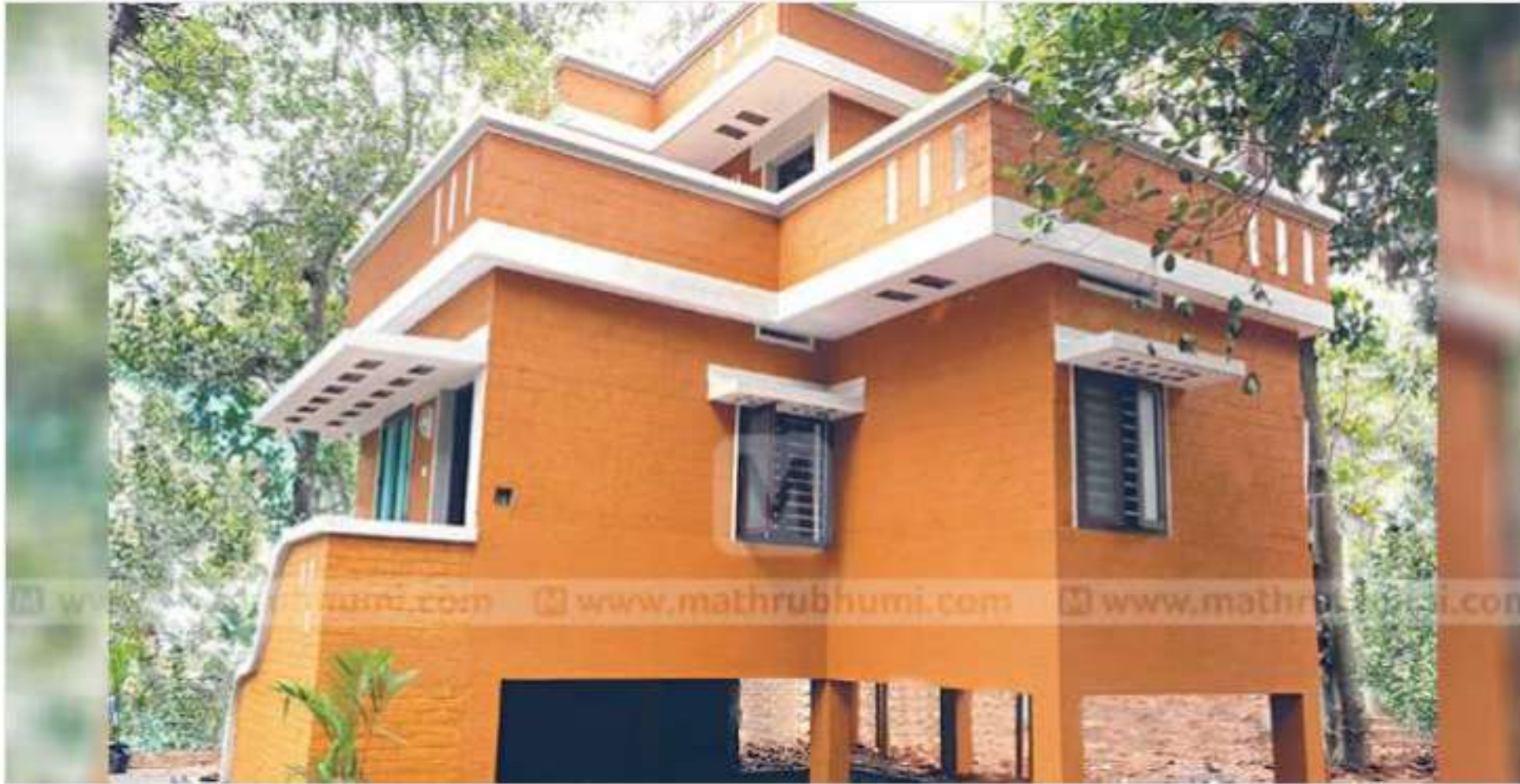
കേരള പോലീസിനു വേണ്ടി ഹാബിറ്റാറ്റ് നിർമ്മിച്ച പ്രളയത്തെ അതിജീവിക്കാൻ ശേഷിയുള്ള വീട്