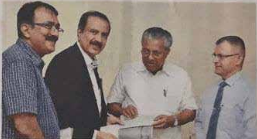
കേരളത്തിന്റെ പുനർനിർമ്മാണത്തിനായി ആസ്റ്റർ ഡി.എം. ഹെൽത്ത് കെയർ നൽകുന്ന 15 കോടി രൂപയിൽ രണ്ടരക്കോടി രൂപയുടെ ചെക്ക് ഡോ. ആസാദ് മുപ്പൻ മുഖ്യമന്ത്രി പിണറായി വിജയന് കൈമാറുന്നു.

തിരുവനന്തപുരം ▶ പ്രളയാനന്തര കേരളത്തിന്റെ പുനർനിർമ്മാണത്തിന് ആസ്റ്റർ ഡി.എം. ഹെൽത്ത് കെയർ 15 കോടി രൂപയുടെ പദ്ധതി പ്രഖ്യാപിച്ചു. 15 കോടി രൂപയിൽ രണ്ടരക്കോടി രൂപയുടെ ചെക്ക് ആസ്റ്റർ ഡി.എം. ഹെൽത്ത് കെയർ ചെയർമാനും, മാനേജിംഗ് ഡയറക്ടറുമായ ഡോ. ആസാദ് മുപ്പൻ മുഖ്യമന്ത്രി പിണറായി വിജയന് കൈമാറി. പുതിയ വീടുകൾ നിർമ്മിക്കുന്നതിനും പ്രളയാനന്തര നശിച്ച പ്രദേശങ്ങളിലെ വീടുകൾ നന്നാക്കുന്നതിനുമുള്ള ആസ്റ്റർ ഹെൽത്ത് പദ്ധതിക്ക് ബാക്കി 12.5 കോടി രൂപ വിനിയോഗിക്കുമെന്ന് ഡോ. ആസാദ് മുപ്പൻ പത്രസമ്മേളനത്തിൽ അറിയിച്ചു.